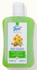
Bálsamo Loción Corporal con Árnica y Hamamelis